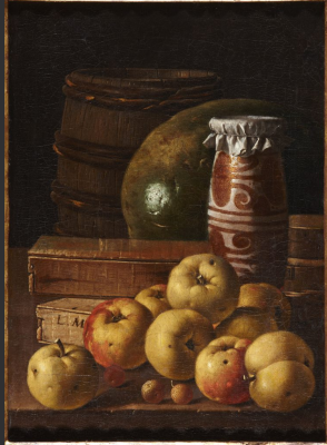
Luis Egidio Meléndez Naturaleza muerta con manzanas, fresas, sandía, cajas de dulces, tarro de miel y barril. Óleo sobre lienzo, firmado en una de las cajas con las iniciales "L.M." 48 x 34,5 cm