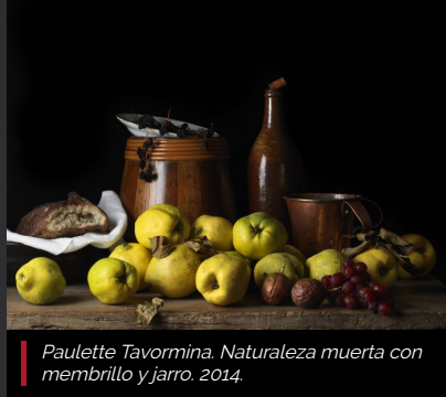
Paulette Tavormina. Naturaleza muerta con membrillo y jarro. 2014.